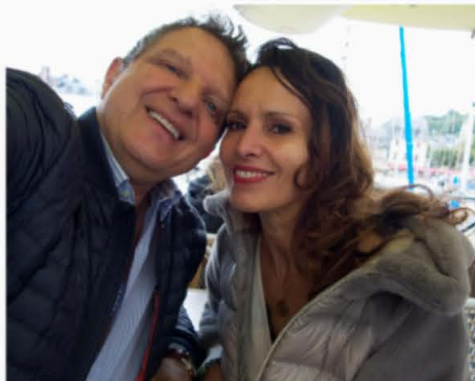
Document: dr AR le MAire / Doc Info Endolift